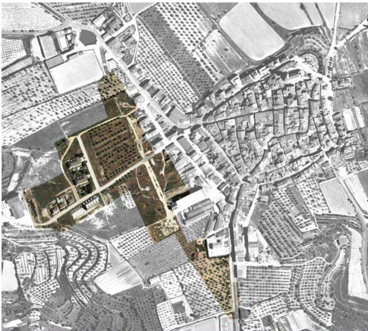
Model de creixement tipus eixample (elaboració pròpia)

El POUM tindrà especial cura en donar una resposta singularitzada a cada tipus de teixit, adequant les determinacions normatives a les especificats tipològiques de cada parcel·la.