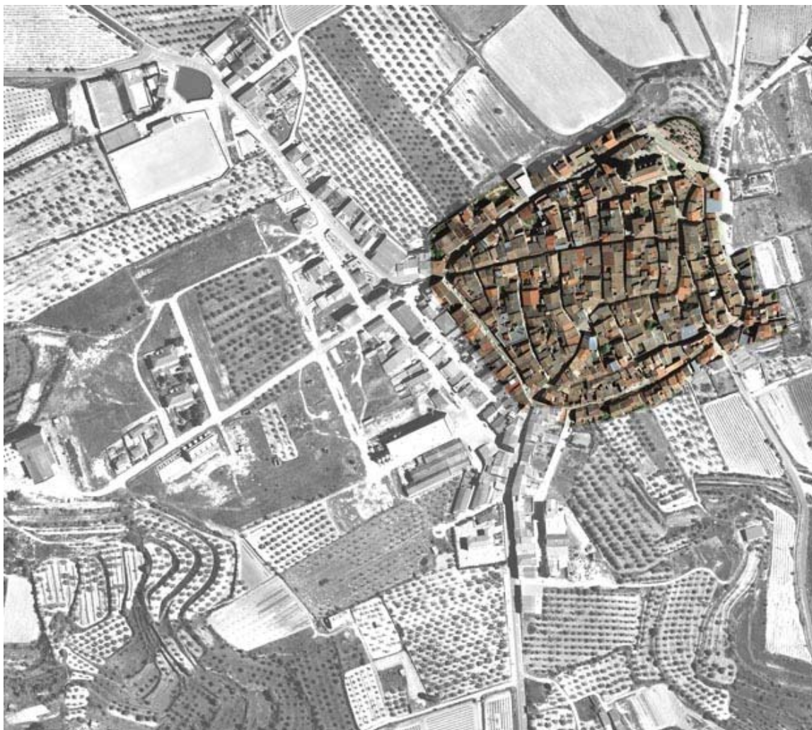
Model de creixement nucli antic (elaboració pròpia)