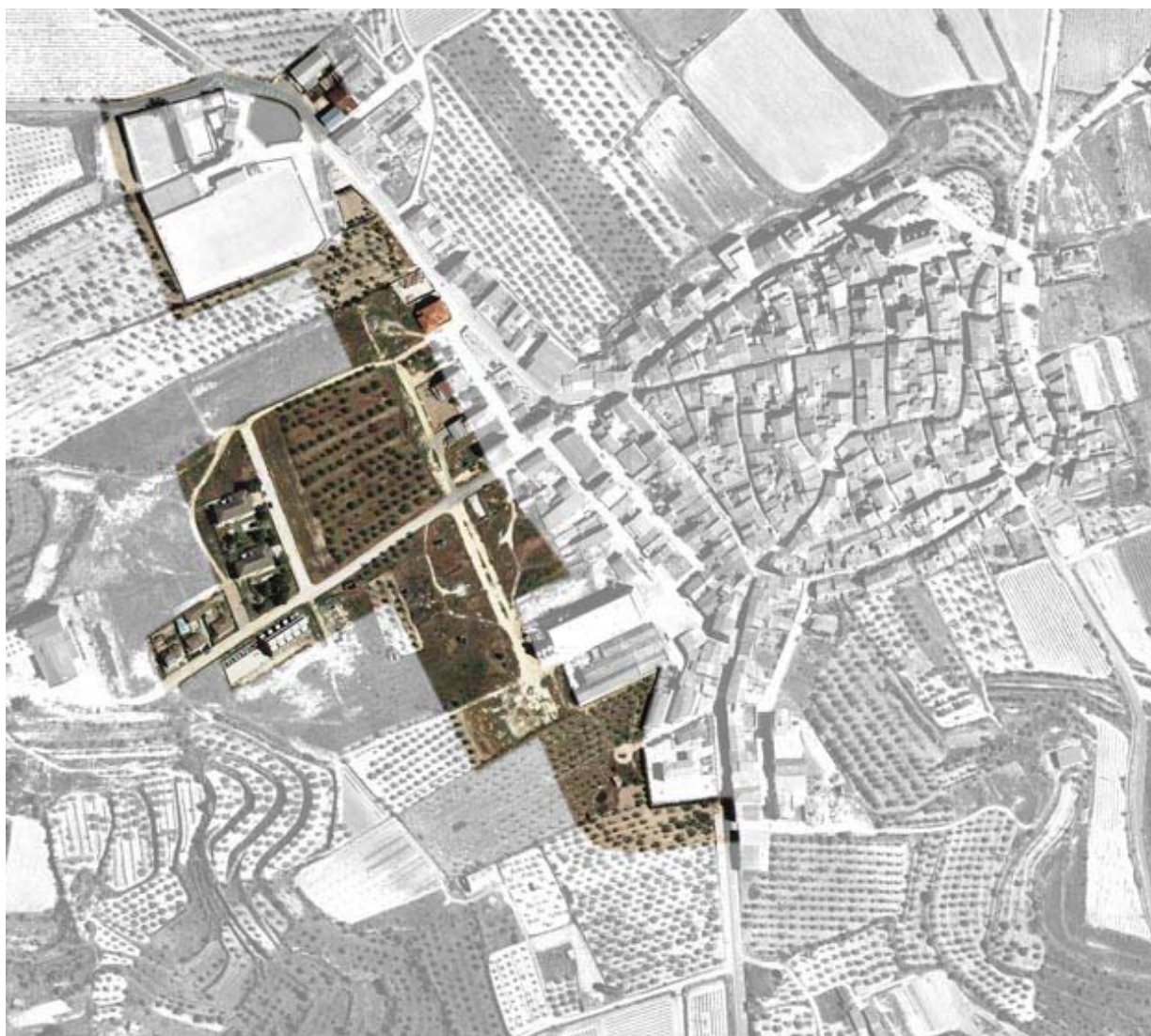
Ortofotomapa actual (vol 2012). Àmbit de l'ampliació de la Delimitació de sòl urbà aprovada el 30 de març de 1995

Pel que respecta a la l'ampliació de la Delimitació del sòl urbà cal indicar tal i com es pot comprovar a l'ortofotomapa que es grafia a continuació que la seva consolidació ha estat quasi bé nul·la. Per poder facilitar la seva gestió, el POUM proposarà la delimitació de diferents Polígons d'actuació que tinguin en compte l'estructura de la propietat, d'aquesta manera es pot anar completant el teixit previst inicialment. La normativa haurà de preveure un ampli ventall de tipologies edificatòries que es puguin adaptar a les necessitats dels usuaris, tot introduint unes ordenances d'estètica que afavoreixin la seva integració en l'entorn paisatgístic.