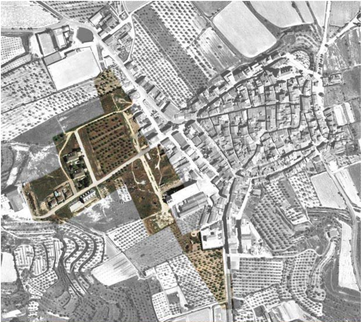
Model de creixement tipus eixample (elaboració pròpia)