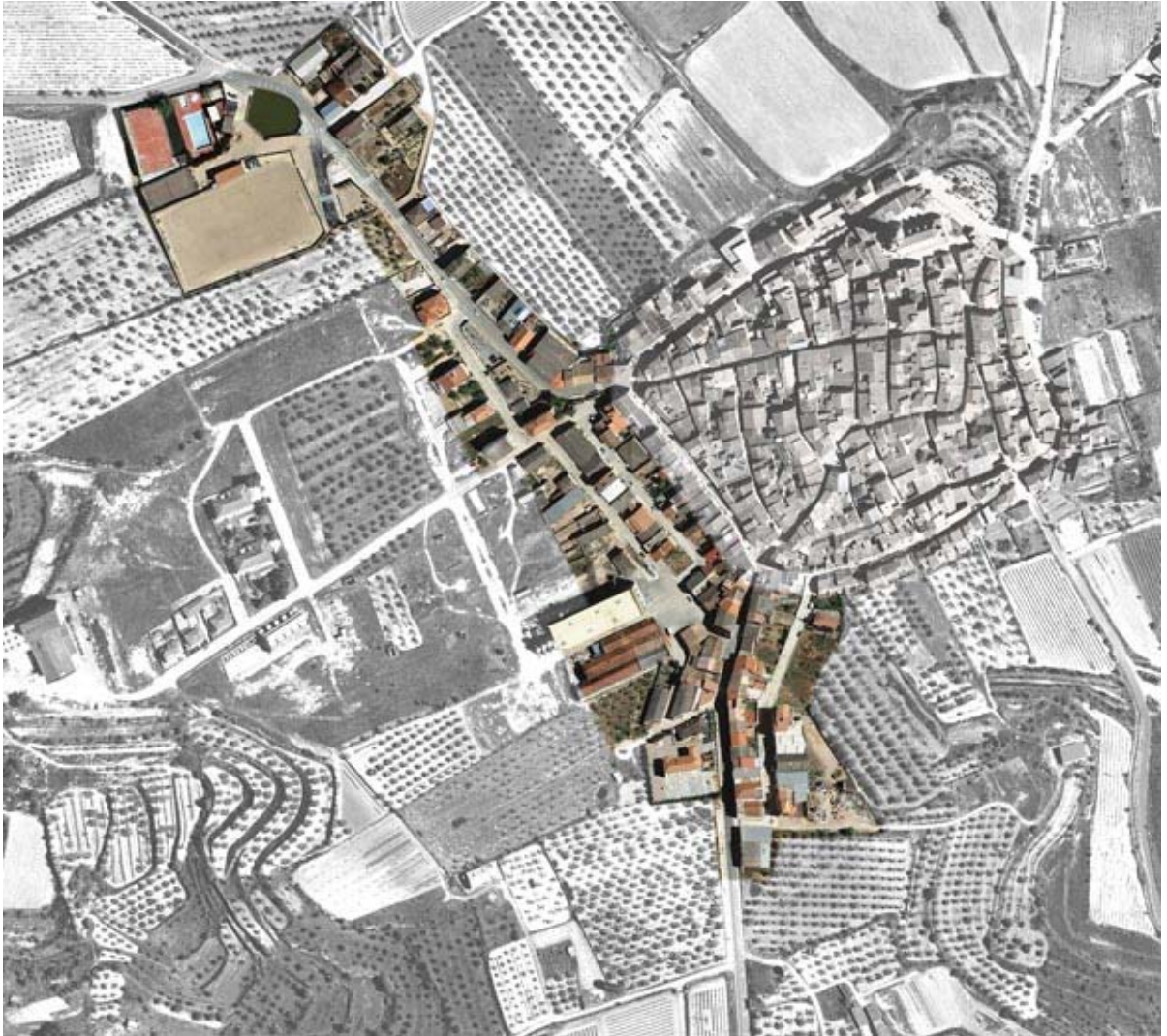
Model de creixement tradicional tipus raval (elaboració pròpia)