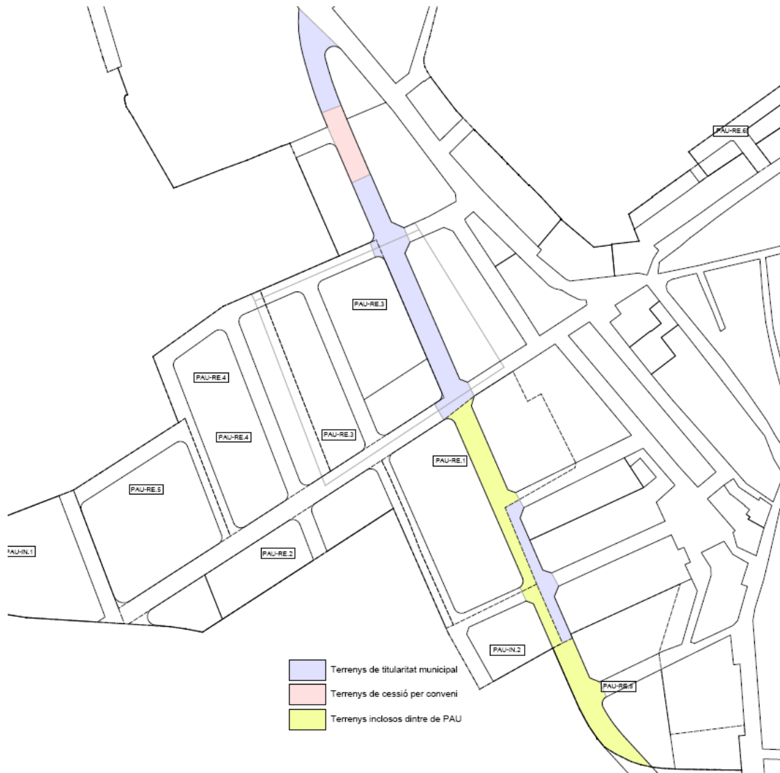
Disponibilitat dels terrenys de la futura avinguda Generalitat

Pel que respecta el carrer Fornets, el qual suposa l'altre eix vertebrador de tota l'àrea prevista de nou creixement, l'executarà l'ajuntament de Vilalba dels Arcs amb fons propis destinats a aquesta actuació.