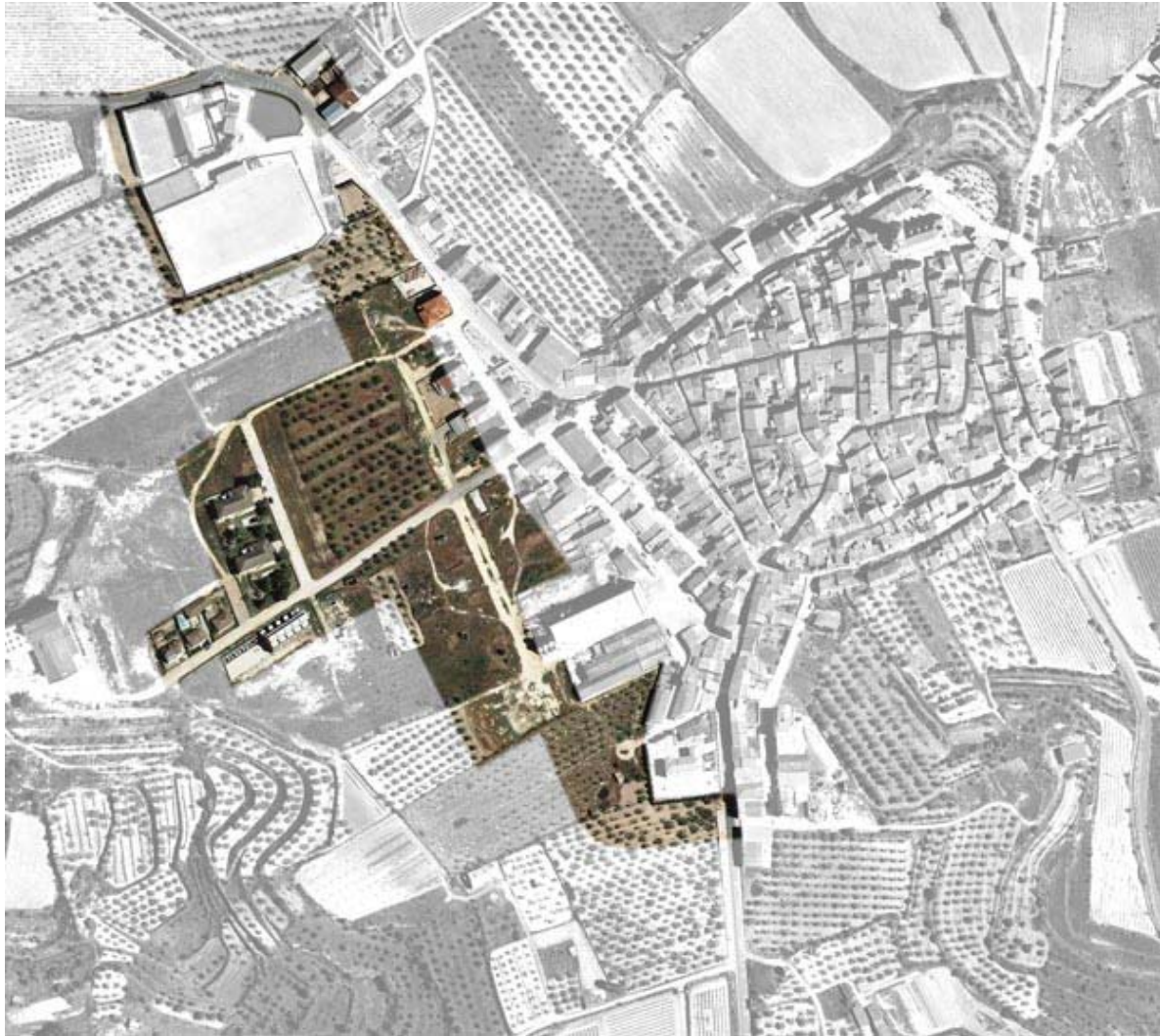
Ortofotomapa actual (vol 2012). Àmbit de l'ampliació de la Delimitació de sòl urbà aprovada el 30 de març de 1995