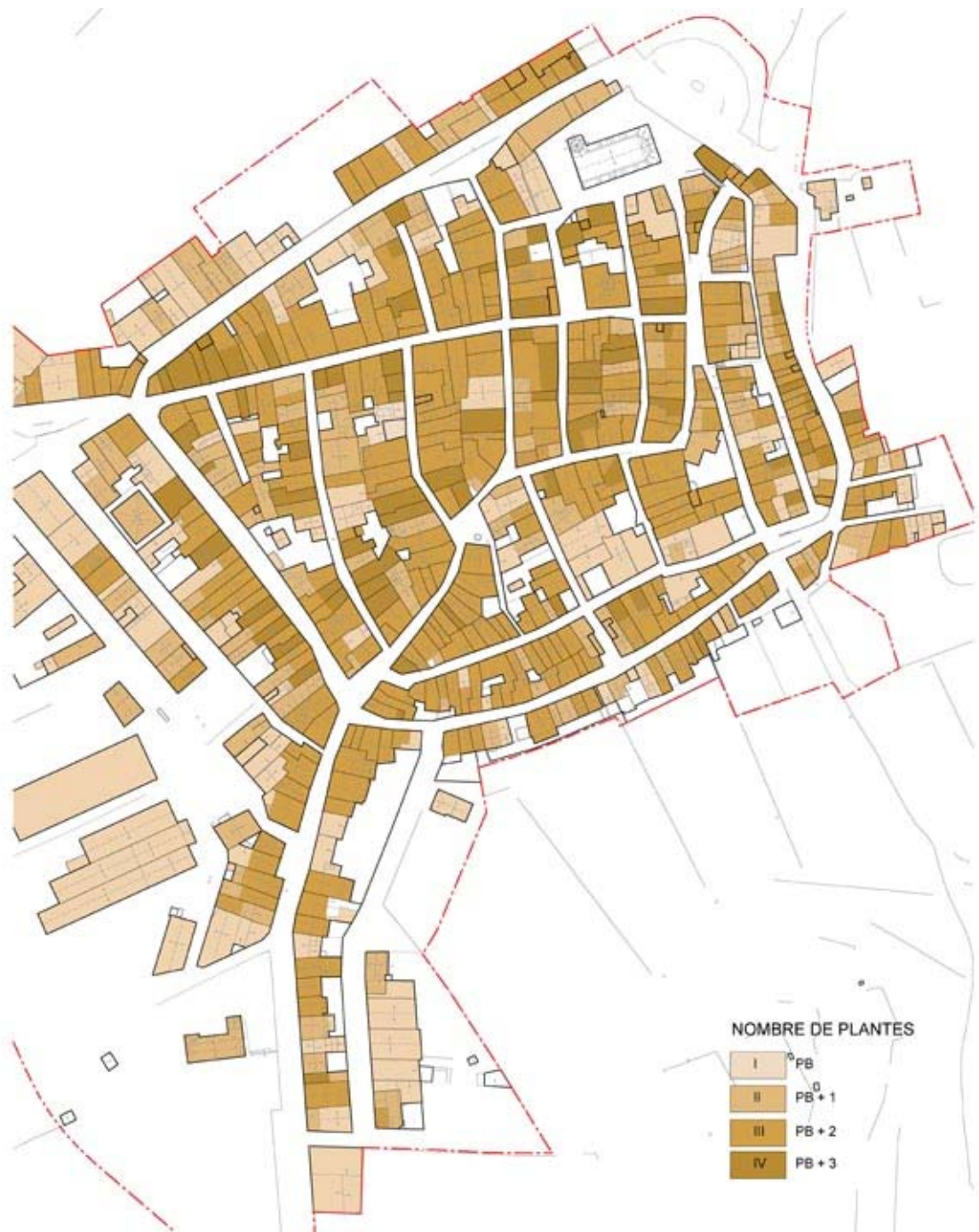
Anàlisi del nombre de plantes de les edificacions del nucli urbà de Vilalba dels Arcs (elaboració pròpia)