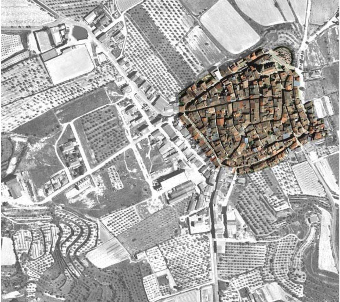
Model de creixement nucli antic (elaboració pròpia)

profunditat, de forma irregular, amb carrers d'amplada entre 4 a 8 metres, els quals ofereixen un caràcter predominantment de ciutat medieval. Aquest teixit té un enorme interès tipològic i arquitectònic.